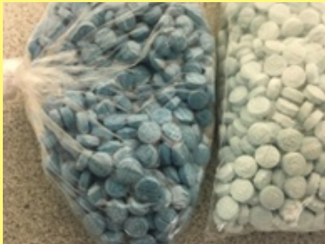
Counterfeit pressed pills containing fentanyl.

distinguir entre una pastilla falsa y una fabricada por una compañía farmacéutica. Las falsificaciones a menudo tienen la intención de aparecer como el analgésico común de grado farmacéutico oxicodona. Estas pastillas falsificadas se prueban cada vez más positivo para el fentanilo y comúnmente se disfrazan como otras drogas y