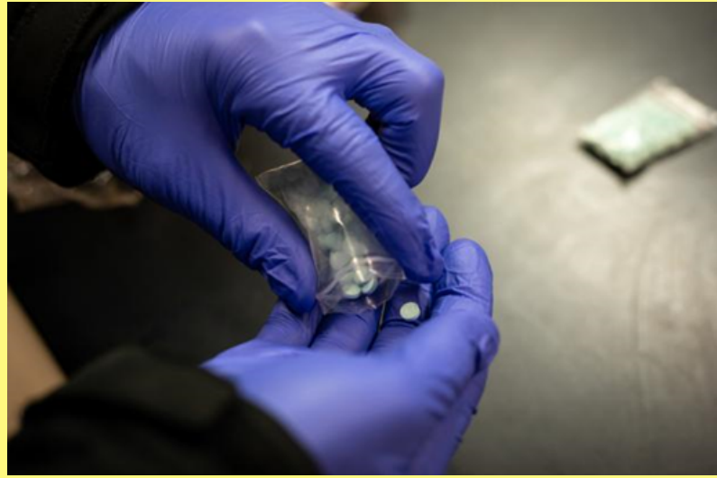
Counterfeit pills containing fentanyl seized by the Multnomah County Sheriff's Office, 2021

A pesar de la reducción del número de prescripciones de opioides para el dolor y la disminución del consumo de heroína, los funcionarios locales de salud y los cuerpos policiales están preocupados por un aumento en las sobredosis relacionadas con pastillas alteradas y sustancias mezcladas con el fentanilo. Cuando se habla de pastillas falsas que contienen fentanilo, el Dr. Bill Koenig, oficial de salud pública del Condado de Yamhill, dice que "se ha aumentado el riesgo."