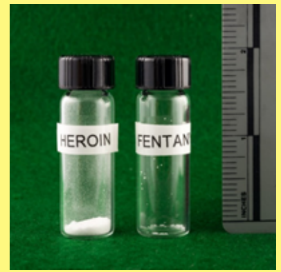
Dosis letal de heroína versus dosis letal de fentanilo

Más de 81,000 muertes por sobredosis de drogas ocurrieron en los Estados Unidos en los 12 meses que terminaron en mayo de 2020, el número más alto de muertes por sobredosis jamás registrado en un período de 12 meses, según datos provisionales recientes de los Centros para el Control y la Prevención de Enfermedades (CDC).